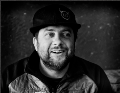
Alex Leitung Restaurant & Bar